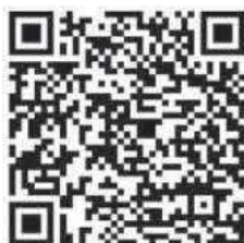
Google Play (Android)

Der FALK-Stiftung danken wir an dieser Stelle für die Förderung zur Entwicklung und Erstellung der App.