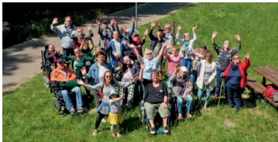
Welt MS-Tag im Schweriner Zoo

Der Techniker Krankenkasse und der Rentenversicherung Nord danken wir an dieser Stelle für die finanzielle Unterstützung zur Umsetzung unseres Landesweiten MS-Tages.