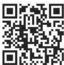
App Store (iOS)

Die App ist für Android und iOS in den jeweiligen Stores verfügbar: