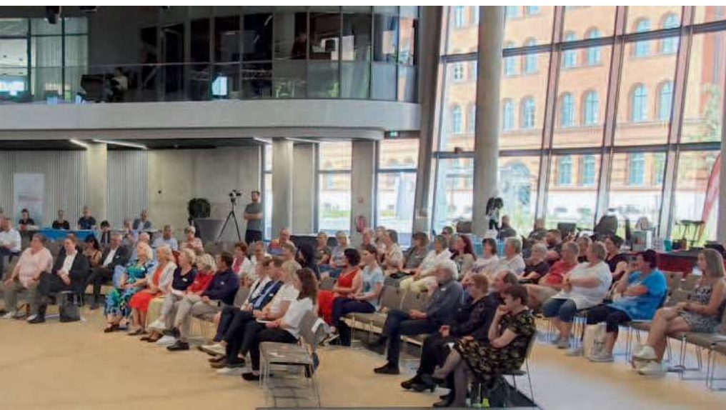
Landesweiter MS-Tag mit integriertem Jahresempfang, Bild: Steffen Strehlow